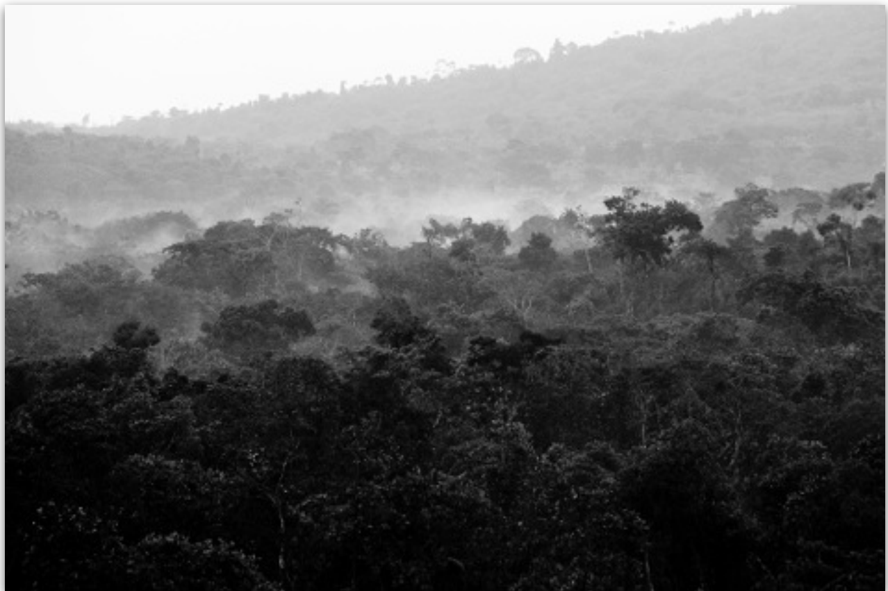
2014 | Ntenjeru rise

Sinds het eerste bezoek worden we steeds met een zeer belangrijk dier in Oeganda geconfronteerd: de koe. Tijdens het reizen reden we steeds door het Ntenjeru county , daar waar een levendig kruispunt was, dronken we aan het eind van de dag iets om de dag te evalueren en de plannen voor de volgende dag door te spreken. Een van de belangrijkste foto's uit de autonomen serie van Linelle is Ntenjeru rise genoemd. Nthenjeru is Luganda voor witte koe, en op die foto stijgen de dampen na regen op. Het herrijzen van het witte koeien land, vruchtbaar en vol perspectief. Aan de school in dit gebied hebben Linelle Deunk en Daniëlle de Boorder in 2014 vele malen een bezoek gebracht aan de school aldaar, waar ook de plannen zijn ontstaan om de ontmoette kinderen meer perspectief te bieden.