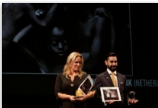
2015 | Siena International Photography Awards 2015: 1e prijs categorie People and Portraits .